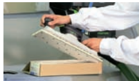
Nem udskiftning af slibepapir takket være StickFix.