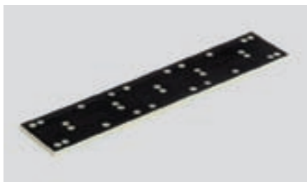
Slibesålen på LRS 400 er af slidstærk MPE-kunststof. Det giver en længere levetid og gør maskinen mere økonomisk.