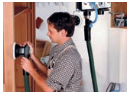
Takket være den lave vægt og den komfortable betjening er LEX 2 excentersliberne også velegnet til arbejde på lodrette flader.

Ved krævende slibeopgaver på værkstedet eller længerevarende brug i industrien behøver man en robust og pålidelig maskine. Festool har med sit program af trykluftmaskiner den passende løsning til næsten alle anvendelser.