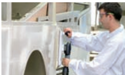
LRS 400: Udviklet og konstrueret til lettere bearbejdning af store flader – både jævne og ujævne flader.

Hvis nogen producerer trykluft-rystepudsere med en fremragende ydelse og et gennemtænkt design, er det Festool. Som eksempel kan nævnes LRS 400. Dens ergonomiske udformning og ideelle vægt-/ydelsesforhold gør arbejdet komfortabelt, så der kan arbejdes længere. Sammen med IAS 2-systemet er LRS 400 den passende partner til slibning af store flader.