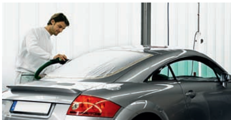
Udviklet specielt til værkstedet: LEX 2 excentersliberen og IAS 2-systemet med støvsuger.