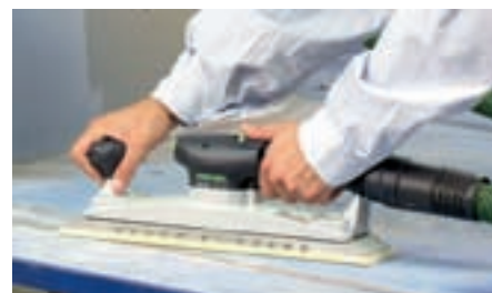
Takket være grebet med softgrip og det ekstra håndgreb har man altid LRS 400 under kontrol.