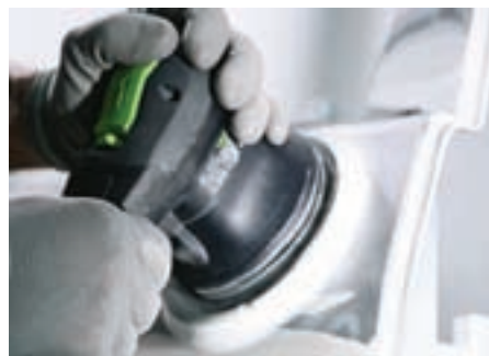
Afslibning af karosseridelen. Trykluft-excentersliberne fra Festool er ideelle til det formål.